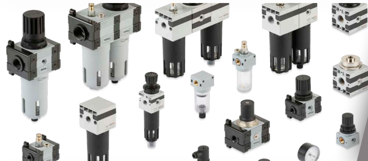
AIR TREATMENT TRATTAMENTO ARIA