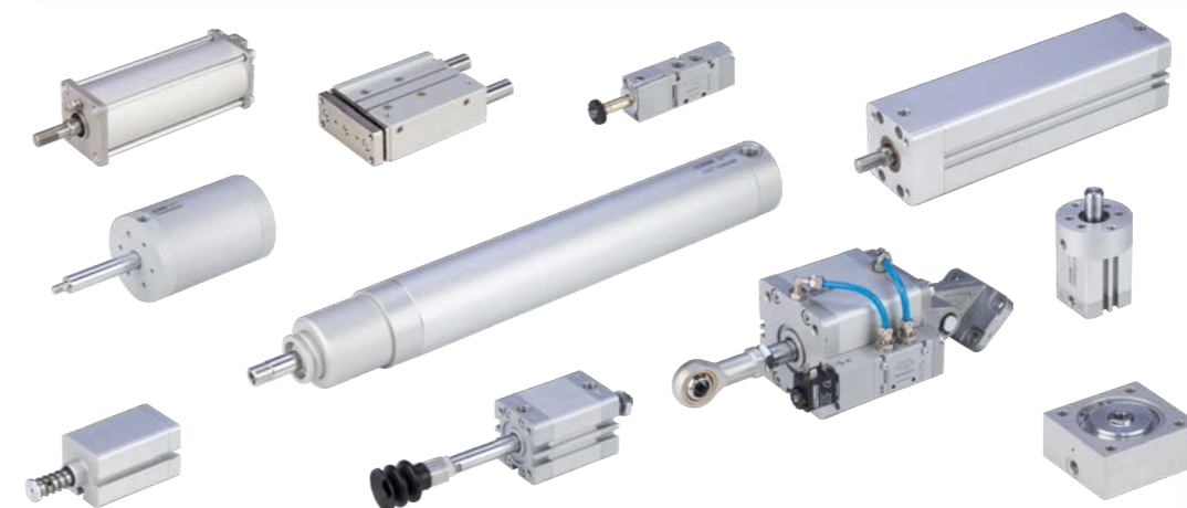
SPECIAL PRODUCT PRODOTTI SPECIALI